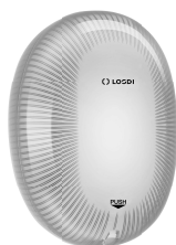
REF: CJ-5004-B Couleur: BLANC