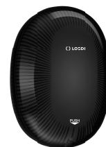
REF: CJ-5004-BL Couleur: NOIR