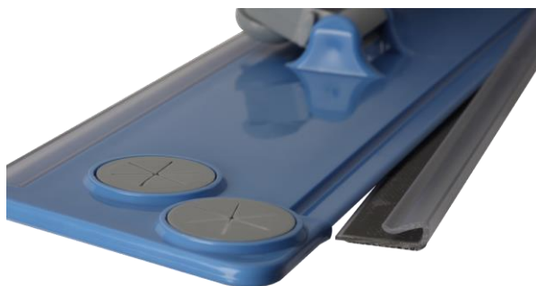
détail du clip bande velcro